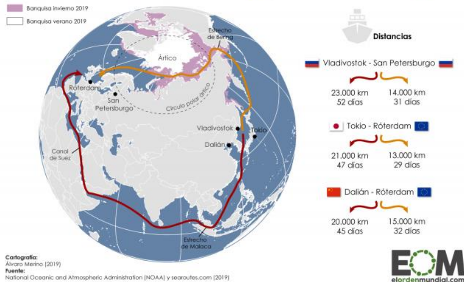
Gráfico de la ruta del ártico 16 .

Comparación entre la ruta del Norte ↗ y la del Canal de Suez ↘